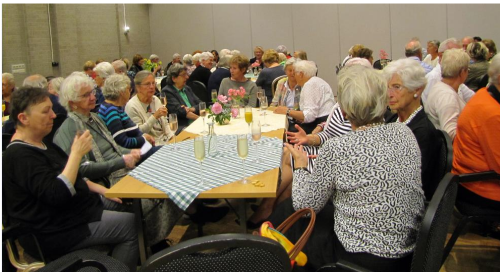
Impressie van het jubileumfeest

Wij hopen nog vele jaren door te kunnen gaan met bridgen bij deze club, in het Klooster.