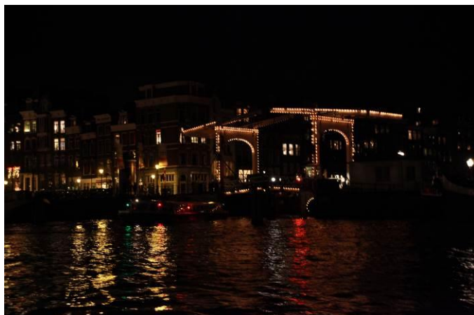
Een mager contract...

Mail je naam en de letter van je antwoord naar de competitieleider van je club, óf naar de docent van je cursus als die een stand bijhoudt. En/óf houdt je ontwikkeling zelf bij met de Excel-spreadsheet, compleet met promotie en degradatie. Die kun je van mijn NAS-schijf plukken, uit de map 'De Excel-bestanden van Ingeborg Slikker'. De link naar die schijf staat in het roze kader.