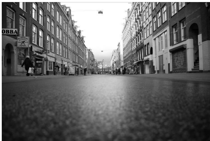
De Amsterdamse Ten Katemarkt, zaterdagmiddag, na een nies...