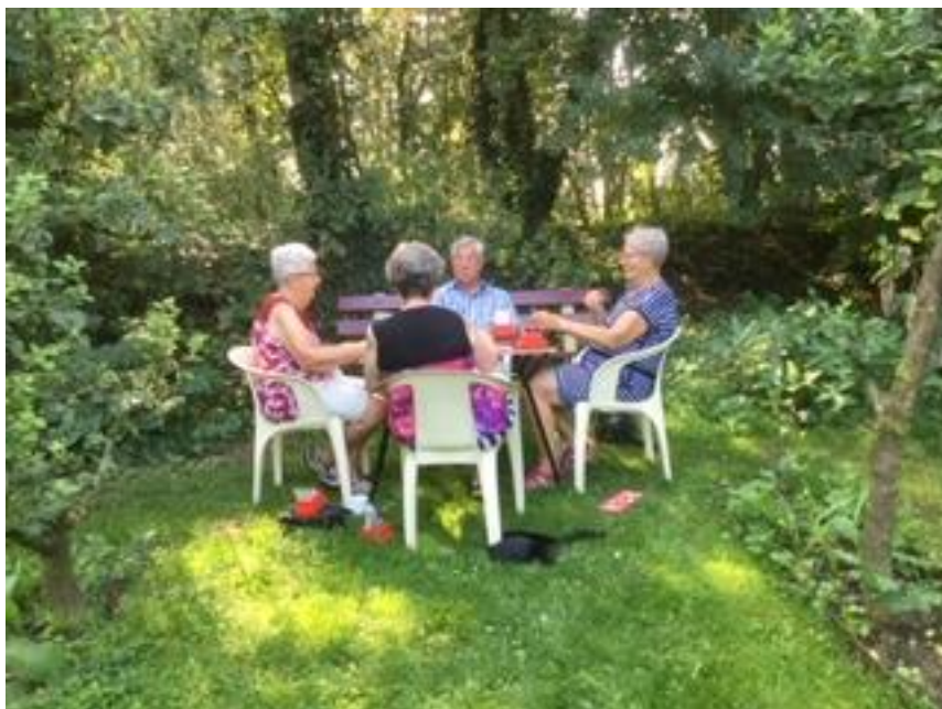
Alle ramen en deuren open...