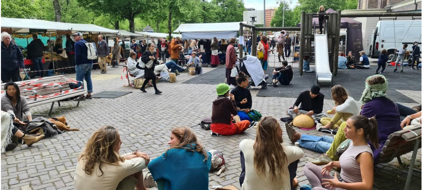
De Amsterdamse Noordermarkt, zaterdagmiddag 16 mei