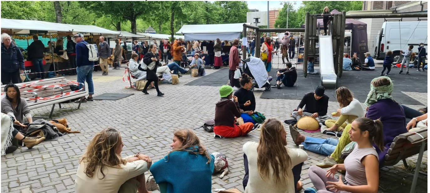
De Amsterdamse Noordermarkt, zaterdagmiddag 16 mei