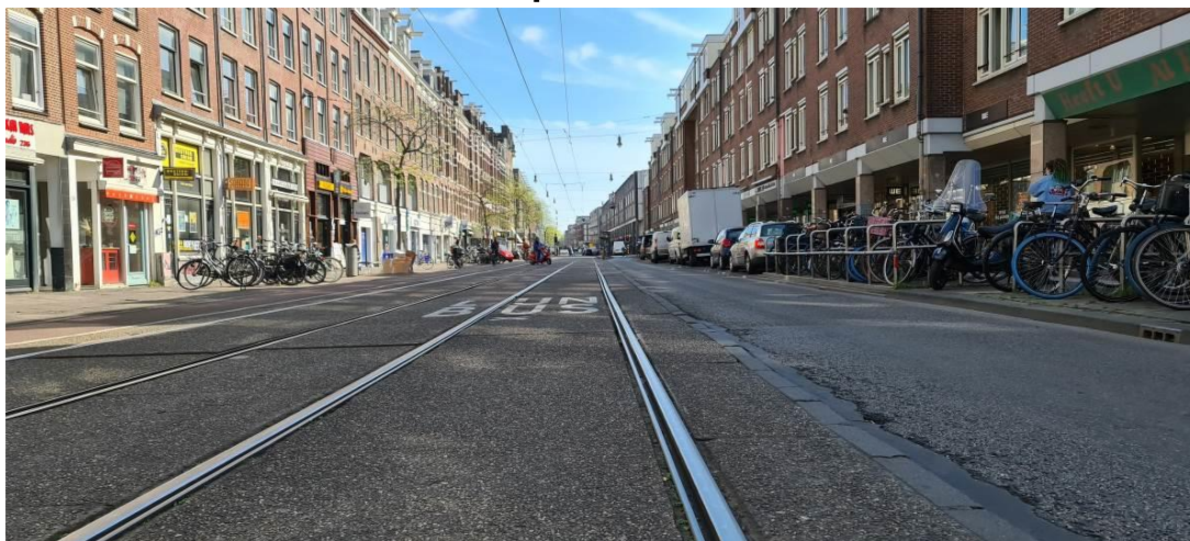
Vrijdagochtend, 'spitsuur' in de Amsterdamse Kinkerstraat